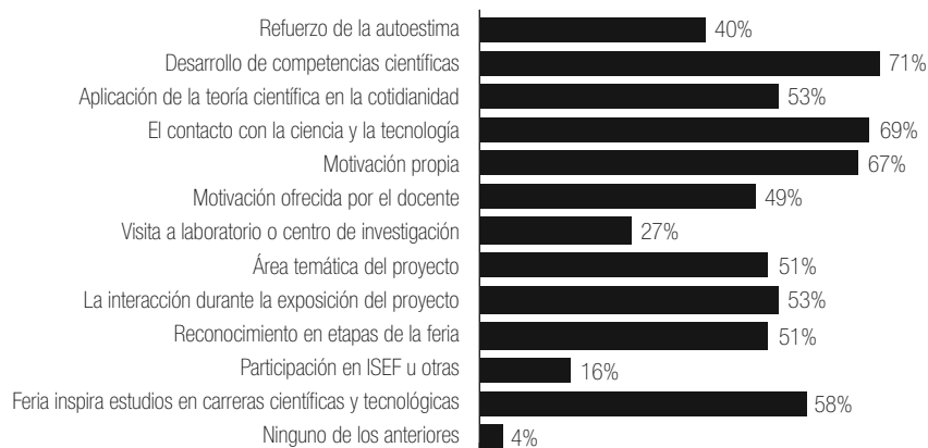
Figura 1 Opinión del estudiantado acerca de los componentes del proceso de Ferias de Ciencia y Tecnología que han influido en su elección de carreras científicas y tecnológicas

En este sentido, es evidente que la motivación, el apoyo, la confianza y el entusiasmo que experimenta el estudiantado durante su participación en las ferias, juegan un papel sobresaliente en su formación integral y en el desarrollo de su vocación, pues es a través de estos procesos que valoran la relevancia de su proyecto, esto al interactuar con otras personas, al investigar temas de su interés y al compartir sus conocimientos.